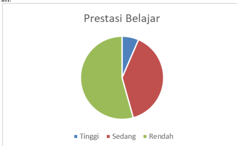
Gambar 2. Diagram Batang Prestasi Belajar PAI

Untuk memberikan gambaran yang lebih jelas mengenai prestasi belajar PAI siswa fase C, data tersebut disajikan dalam diagram lingkaran berikut ini: